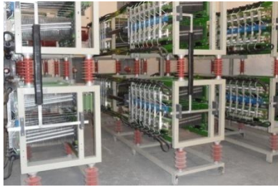
Endüstriyel Tesislerde SVC Kurulumu

Kurulduğu 2005 yılından beri, elektrik sektöründe faaliyet gösteren SAN-EL Mühendislik, 1000 kVA ile 100,000 kVA arasında kurulu elektrik gücüne sahip tüm tesislerin ihtiyacı olan enerji dağıtım kontrol ve kumanda panolarının projelendirmesini, imalatını ve kurulumunu gerçekleştirmektedir.