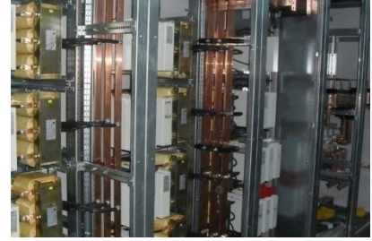
Harmonik Filtre Sistemleri

Şirket, 2012 sonu itibarıyla, 3.000 göz elektrik pano imalatını yaklaşık 60 kişilik bir kadro ve 2.000 mt 2 kapalı alan ile gerçekleştirerek yıllık 47 milyon TL faturalama rakamına ulaşmış ve 3,7 milyon TL kar etmiştir.