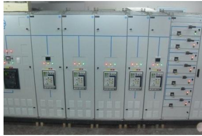
Elektrik Pano Sistemleri